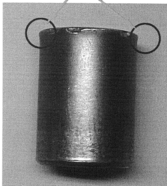
打撃キャップ側面