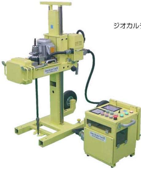
ジオカルテ ® III